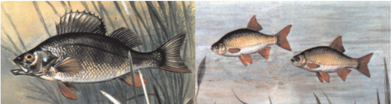
Abb. 2: a) Flußbarsch ( Perca fluviatilis ); aus GRZIMEK (1976, 85) b) Rotfeder ( Scardinius erythrophthalmus ); aus GRZIMEK (1975, 327-328)

Mittelalterliche Belege für Karpfenfische gibt es z. B. von der Isenburg (Rotfeder; n = 2; REICHSTEIN 1981, 22).