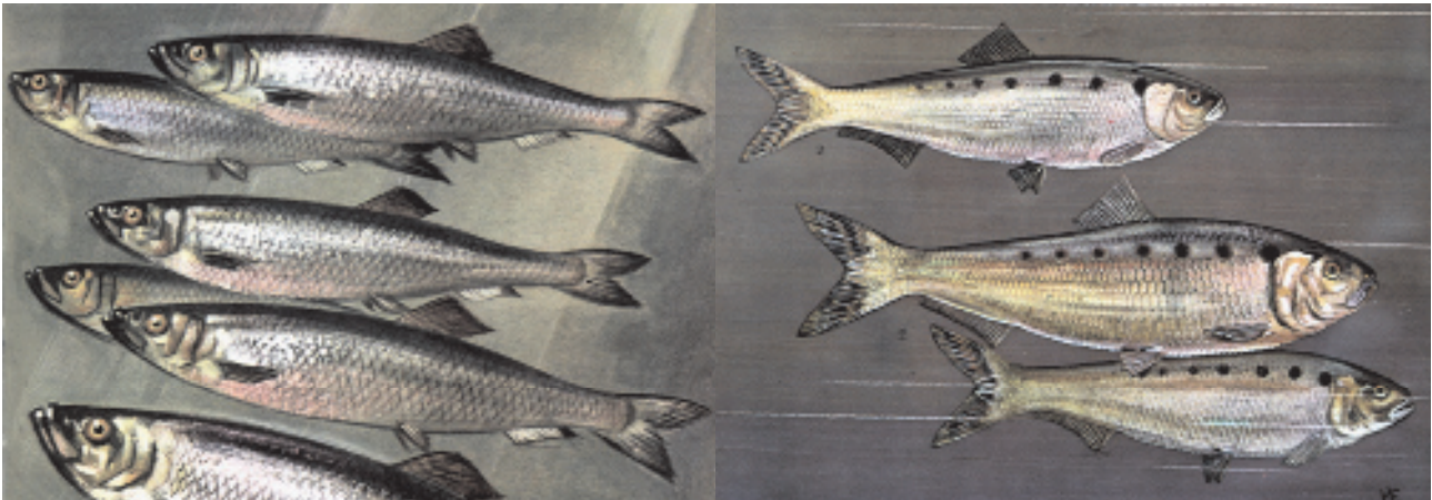
Abb. 1: a) Atlantischer Hering ( Clupea harengus ); aus GRZIMEK (1975, 197) b) Finte ( Alosa fallax ); aus GRZIMEK (1975, 198)

Die Finte bewohnt die europäischen Küstengewässer bis etwa 100 m Tiefe. Sie ist ein anadromer Wanderfisch, d. h. sie steigt zum Laichen in die Unterläufe der Flüsse auf. Finten können bis zu 55 cm lang und 2 kg schwer werden. Heutzutage ist die Finte von geringer wirtschaftlicher Bedeutung. Sie besitzt viele Gräten, ihr Fleisch gilt als trocken und insbesondere nach der Laichzeit als wenig schmackhaft (BROHMER 1984, 423, 440; MUUS & DAHLSTRÖM 1974, 48; SCHUBERT 1975, 200-201).