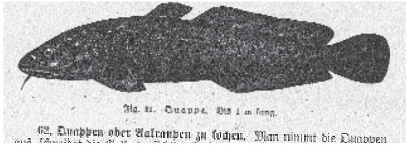
Abb. 4: Quappe ( Lota lota ); aus DAVIDIS-HOLLE (ca. 1880, 261)

„Quappen oder Aalraupen zu kochen. Man nimmt die Quappen aus, schneidet die Galle vorsichtig ab, läßt aber die Leber darin, spült die Fische gut und kocht sie \frac{1}{4} in Wasser, Salz und Essig, läßt sie noch ein wenig darin liegen und gibt sie heiß mit einer sauren Eiersauce, Liebesapfelsauce, Krebs- oder grünen Kräutersauce (Abschnitt R.) zu gekochten Kartoffeln oder kalt mit Essig, Öl und Pfeffer zur Tafel. – Wenig Salz wie beim Aal.