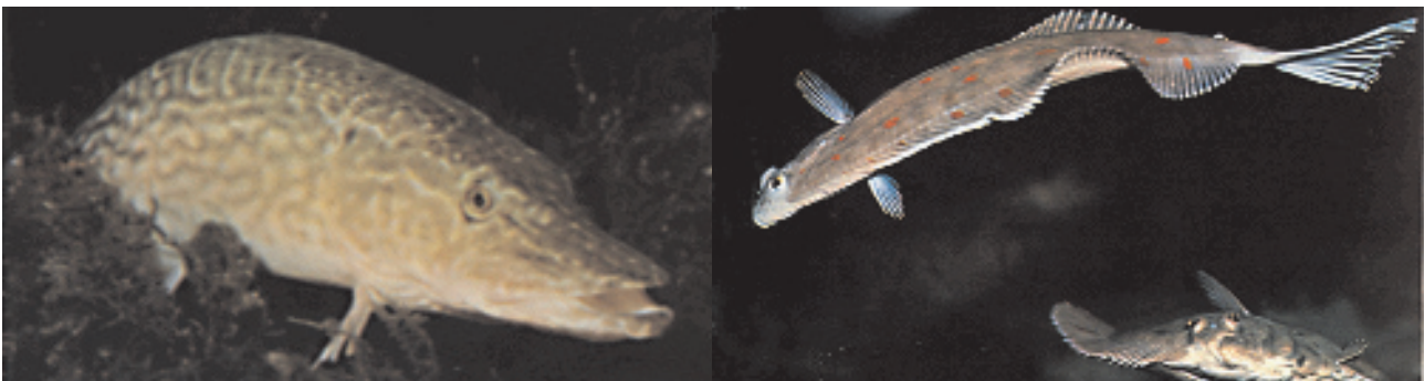
Abb. 3: a) Hecht ( Esox lucius ); aus GRZIMEK (1975, 233) b) Scholle ( Pleuronectes platessa ); aus GRZIMEK (1976, 239)

Anhand der Sehnenlänge des Os anale läßt sich die Größe von Schollen berechnen (LEPIKSAAR & HEINRICH 1977). Leider ist das vorhandene Exemplar nicht vollständig erhalten, sodaß sich das Maß nicht abnehmen läßt, aber der Vergleich mit den bei HEINRICH (1985, 60-61) gezeigten Abbildungen läßt die Schätzung einer Totallänge von 30 - 40 cm zu. HEINRICH (1985, 60-62) geht davon aus, daß es sich bei den Funden aus Elisenhof um die häufigen Arten Scholle, Flunder oder Kliesche handelt. Vermutlich gilt dies auch für den Fund aus Bremen.